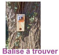
Balise à trouver