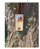
Balise à trouver