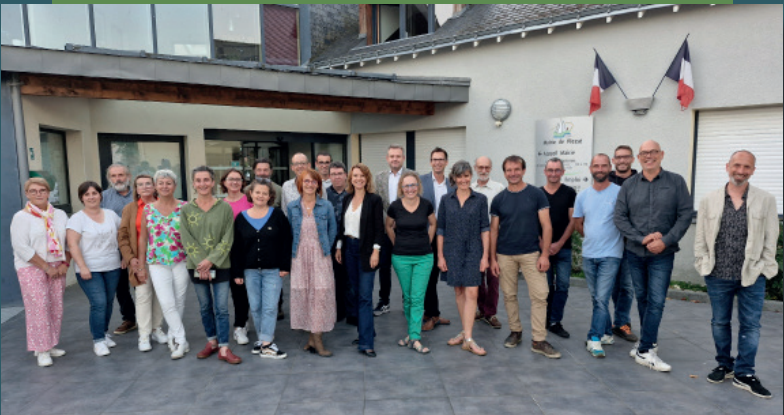
L'équipe municipale de Plessé